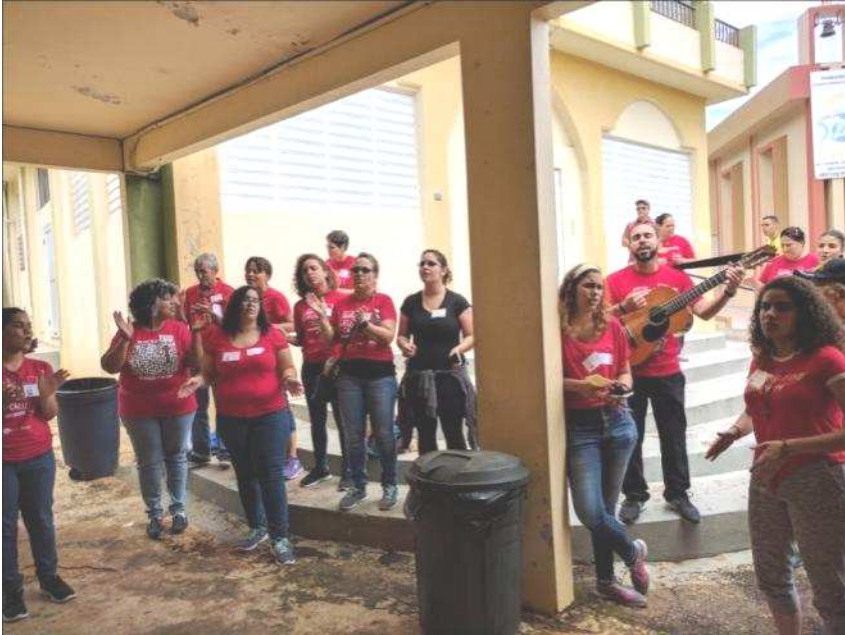
Un gruppo di missionari durante la benedizione del pranzo

I nostri laici hanno ricevuto il grande aiuto di circa 110 missionari che fanno parte del programma delle POM “Verano Misionero”(Estate Missionaria), giovani, adulti e famiglie con bambini provenienti da tutta l’Isola che si preparano per un’esperienza missionaria dentro e fuori da Porto Rico e che prevede, come formazione comune, un’evangelizzazione casa per casa. Mi sono unita a loro con la gioia di vivere un incontro di prossimitá con la nostra gente, per “toccare la carne viva” della realtà portoricana.