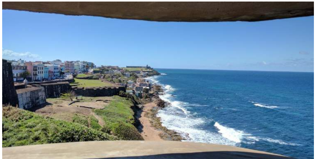
Il Catello S. Cristobal (alle mie spalle)

La fortezza , ora in parte distrutta, continuava lungo il lato del mare aperto fino al Catello S. Cristobal, un'altra fortezza piú piccola. (foto da una ferritoia)