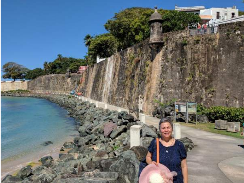
Castello S. Felipe del Morro, detto "El Morro"

Dopo 15 anni gli spagnoli iniziano la colonizzazione dell'isola riconoscendola un punto strategico che, essendo la prima Antilla maggiore, può offrire acqua, rifugio e rifornimento alle navi che arrivano dall'Europa e può diventare la porta d'ingresso verso le grandi ricchezze delle Americhe(oro, argento, pietre preziose, spezie, cuoio...). Gli spagnoli costruiscono da subito un inespugnabile sistema difensivo che è stato rafforzato lungo 250 anni che ha permesso loro di mantenere il controllo dell'isola fino al 1898, quando persero la guerra Ispanoamericana e Porto Rico divenne bottino di guerra dato agli Stati Uniti.