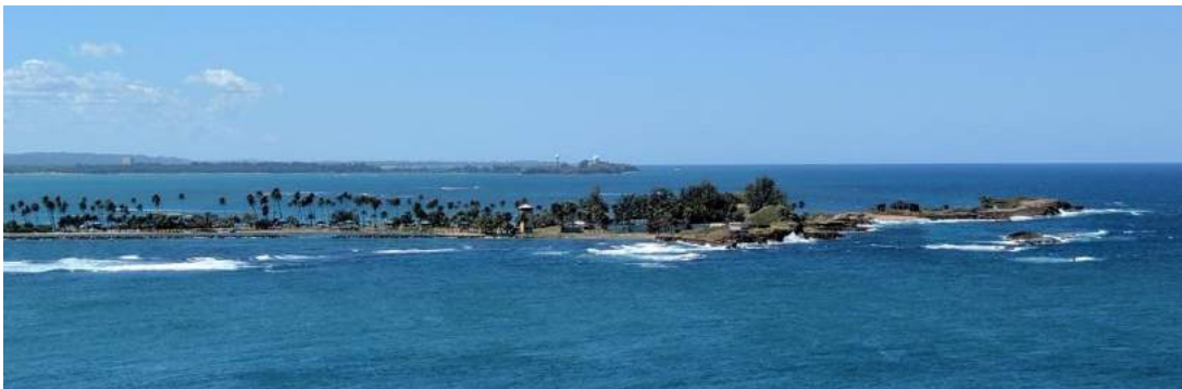
L'isola di Cabras, che è di fronte a El Morro, ha un altro fortino che, per il fuoco crociato, rendeva molto difficile l'entrata nella Baia

El Morro è una fortezza che, al suo interno, ha 6 piani